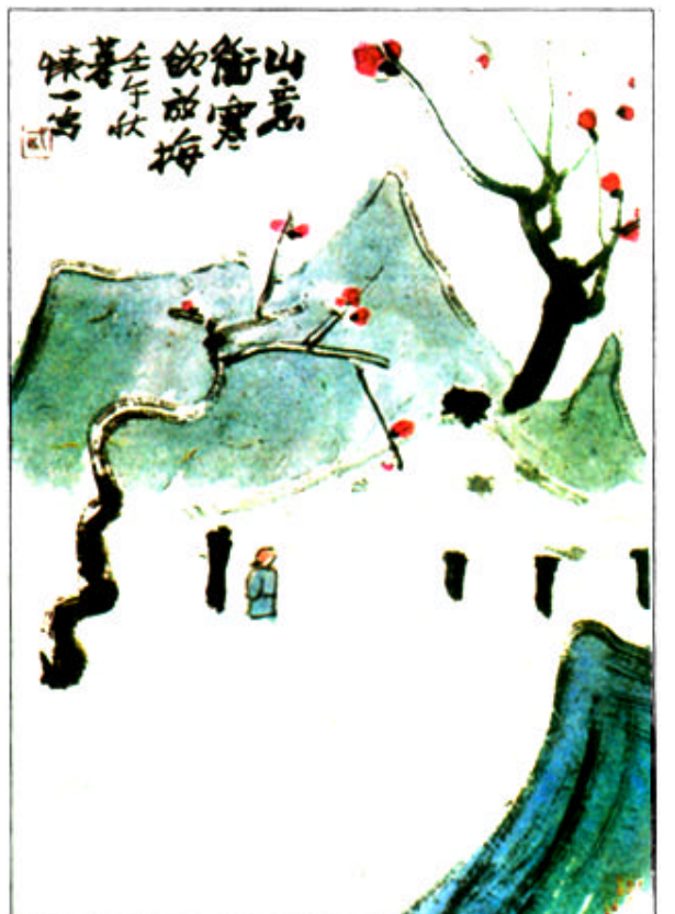
踏雪访梅 (44 x 33cm) 怀一作

2002年7月，我和怀一去五台山游玩。虽是伏天，五台山却很清凉，又逢云雨无常，雷声时作，我们同登黛顶，正值雨雾群山，大雾蒙蒙，迟迟不退。我随口作一联：“云杳雾霭懒，雨住山泉忙”。怀一说：“改一字，改哪一字呢？我至今还在琢磨。