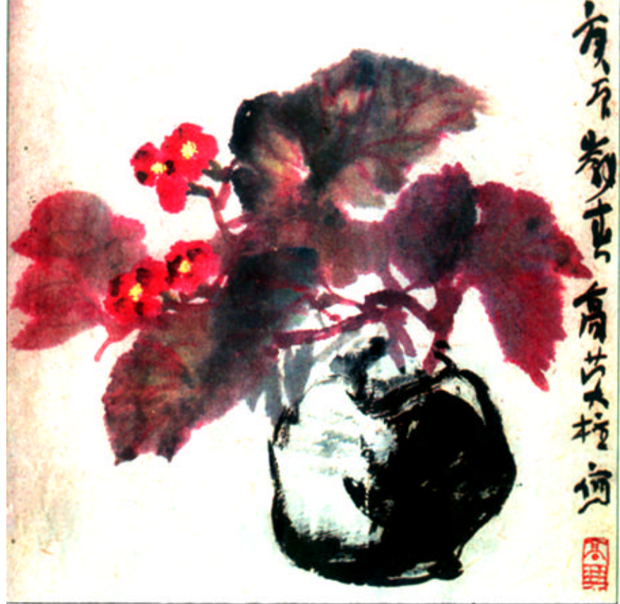
秋海棠 (34 x 34cm) 高英柱作