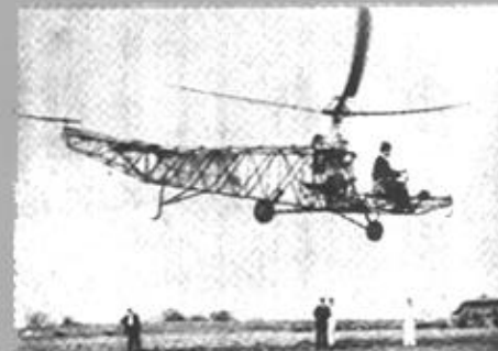
VS-300是人类历史上第一种实用的直升飞机，于1939年首次试飞成功。