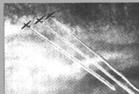
经过一个世纪来的迅猛发展，航空业已成为当今最重要的高技术产业之一。