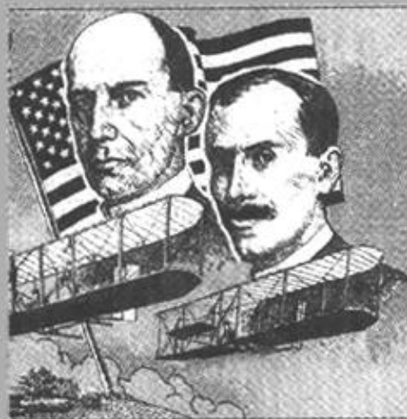
莱特兄弟和他们制作的第一架飞机。